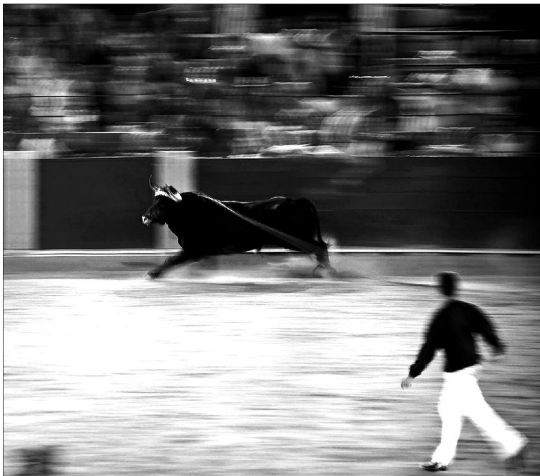
'Esencia', una de las instantáneas más impactantes que pueden verse en la muestra