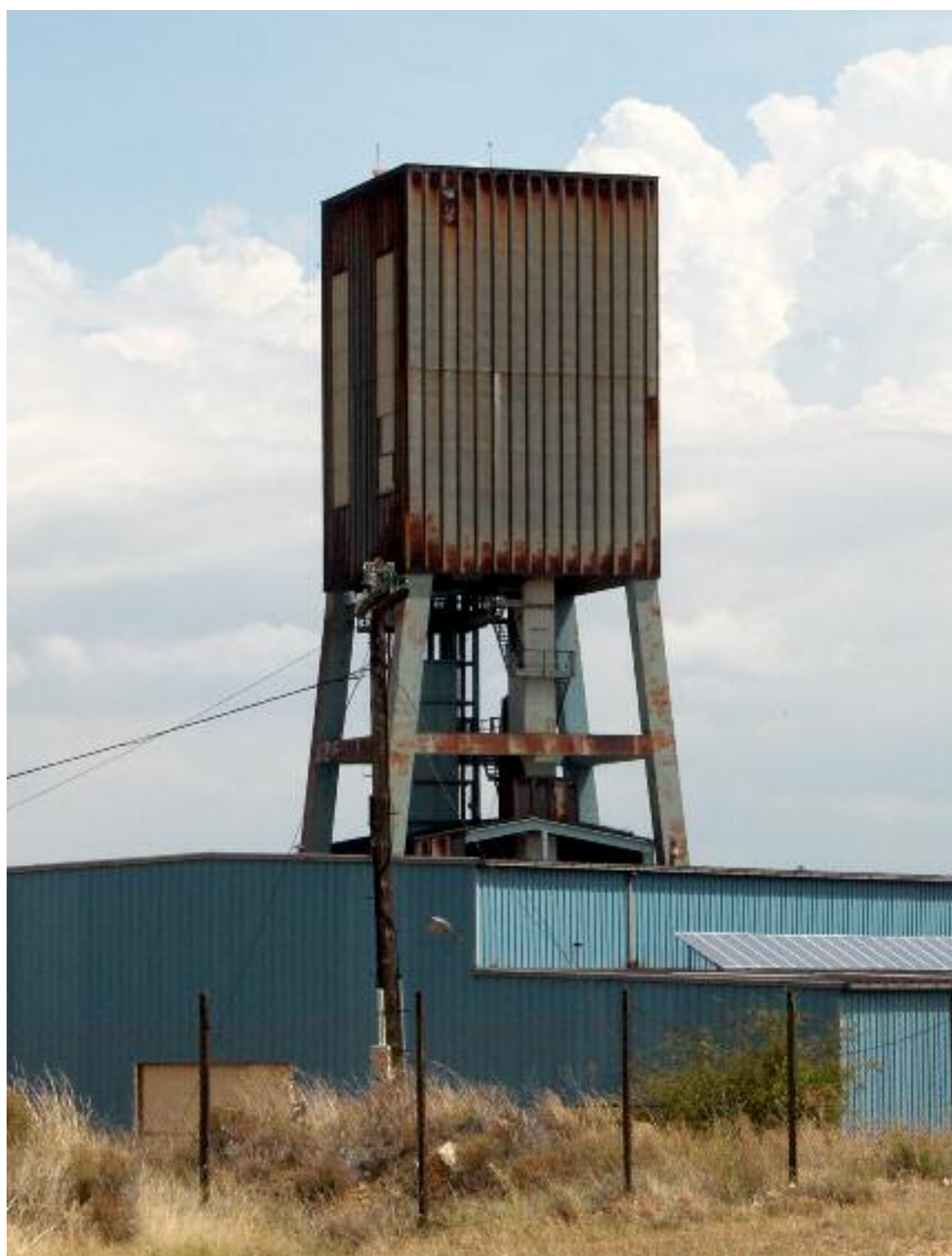
El Pozo Pilar acoger un museo que permite conocer las distintas secciones que tenía MFU y en el futuro se pondrá un mirador.

De cara al futuro se va a continuar trabajando en Pozo Pilar. "El Ayuntamiento de Escucha quiere conservar el patrimonio minero además de ofrecerlo al turismo. Quiere recuperar la parte de arriba del castillete, rehabilitarlo. Se quiere poner un ascensor con dos paradas. Una para la sala de máquinas y en la segunda parada poner una terraza y convertirla en un mirador geológico. Un mirador perfecto, que tiene 60 metros de altura y donde se puede observar la Cuenca Minera". Cañizares comentó que el proyecto lo ha presentado el Ayuntamiento de Escucha al Plan Miner y su presupuesto alcanza una inversión de 700.000 euros. Otro proyecto visitable es hacer una casa del minero en el pueblo de los años cuarenta del siglo XX.