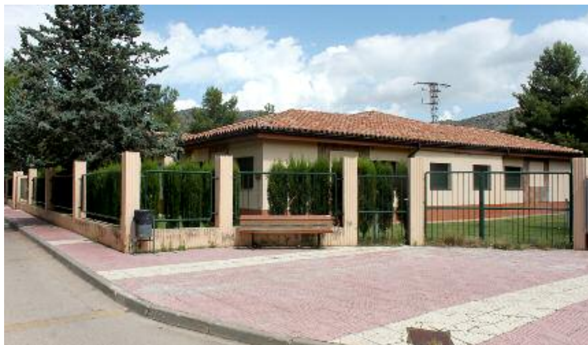
Residencia de Atadi-Adipcmi en Utrillas y que presta servicio a 16 personas con discapacidad intelectual