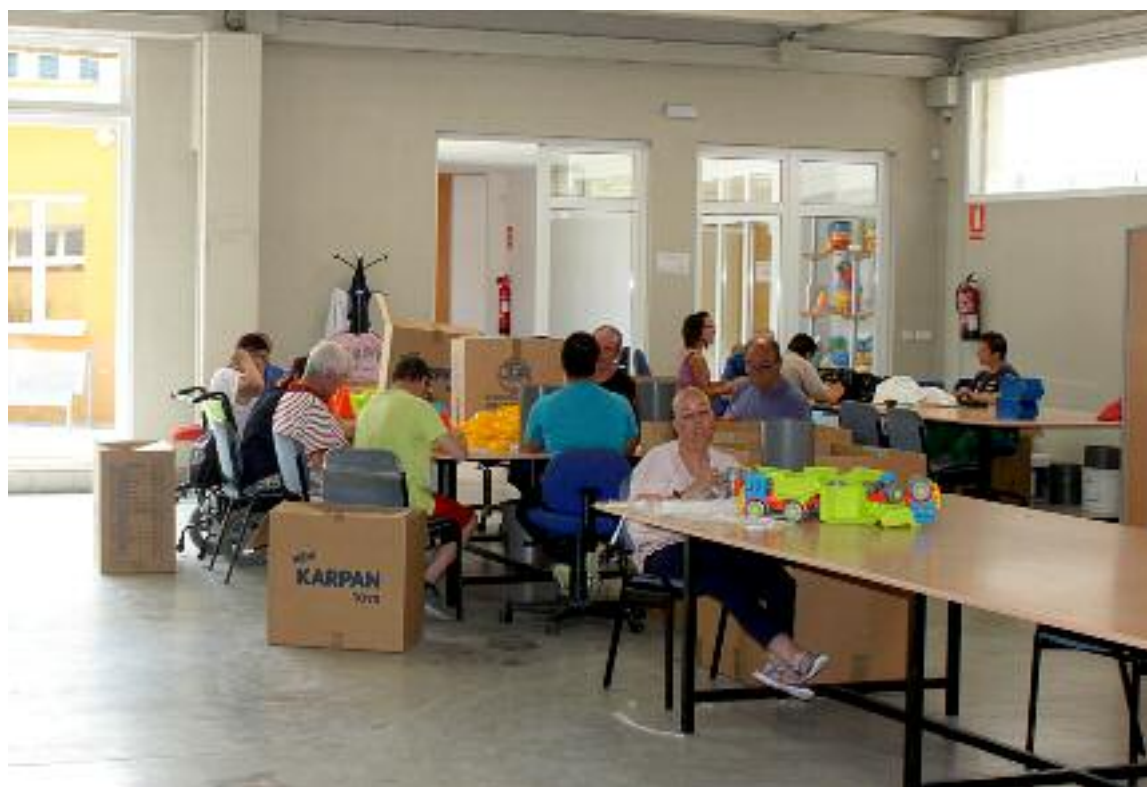
Centro ocupacional para personas con discapacidad intelectual de Atadi en la Comarca de Cuencas Mineras

Desde Ofycumi informaron que el apoyo a Atadi ha sido para el equipamiento de la residencia, basado en trabajos de albañilería para acondicionar terraza existente, instalación de aire acondicionado, gas, cerrajería, instalación de centralita de comunicación con cobertura en toda la residencia, apertura automática de puerta, adquisición de televisores, cadena de música y nevera, equipos informáticos, equipamiento de baño, mobiliario para habitaciones, comedor y cocina, adquisición de menaje, utensilios de limpieza, adquisición de herramientas y mobiliario para jardín y mosquiteras. "Se pretendió con la inversión, dotar a la Comarca Cuencas Mineras de un servicio residencial para personas con discapacidad intelectual que cubra las necesidades existentes en la zona y que mejore su calidad de vida".