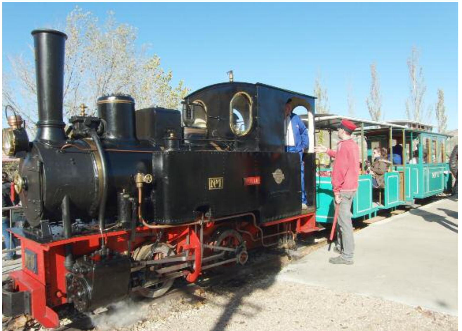
El tren de vapor de Utrillas es una actuación llevada a cabo por el Ayuntamiento de la localidad y que ha contado con el apoyo de Ofycumi

En principio, explicaron desde Ofycumi, esta máquina de vapor y su vagoncillo serán expuestos al público, además de la realización de trayectos, en una sala de máquinas restaurada y situada dentro del conjunto que conforman las antiguas instalaciones mineras del Pozo Santa Bárbara, que además albergarán el parque temático de la minería del carbón, y en un futuro, cuando esté finalizada la recreación del tramo urbano de la línea del ferrocarril minero, se pretende utilizar esta locomotora de vapor y el vagón para la puesta en marcha de un ferrocarril minero que realizará el trayecto desde el Centro Muse-