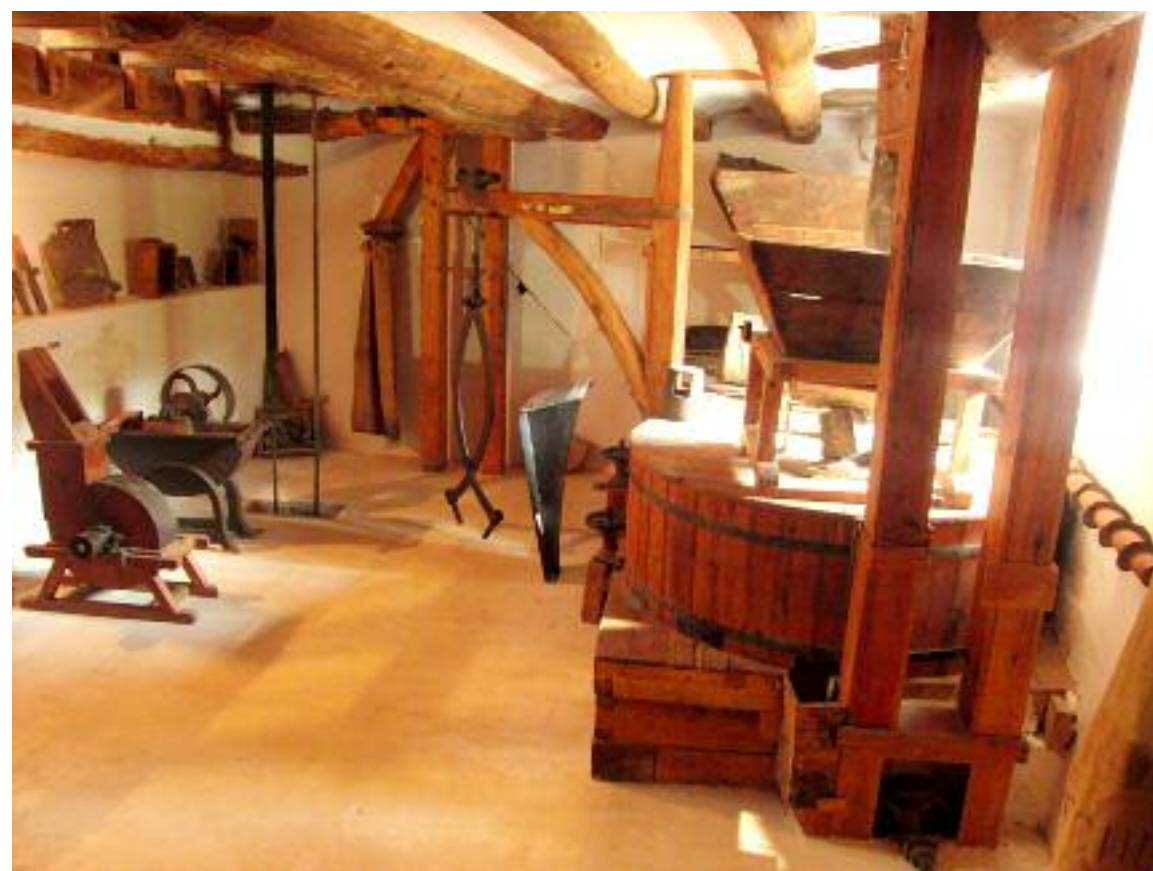
El antiguo molino harinero de Blesa se ha reconvertido en centro de interpretación de molinería y apicultura