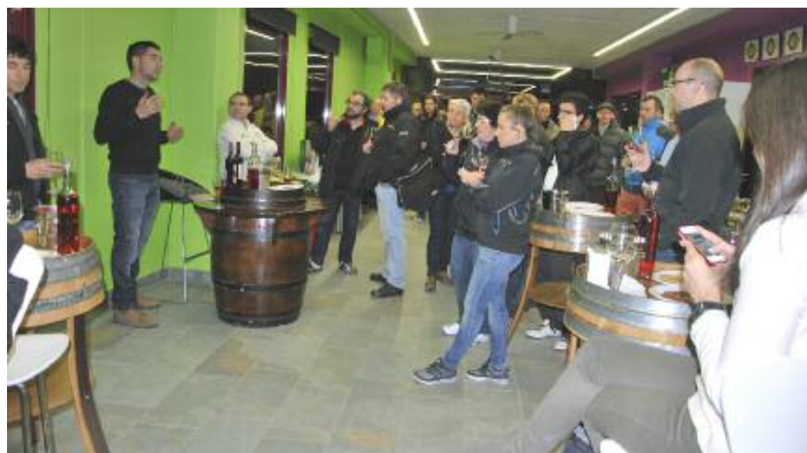
Cata comentada en Bodegas Crial de Lledó

Con nuevas oficinas, sala de catas y laboratorio