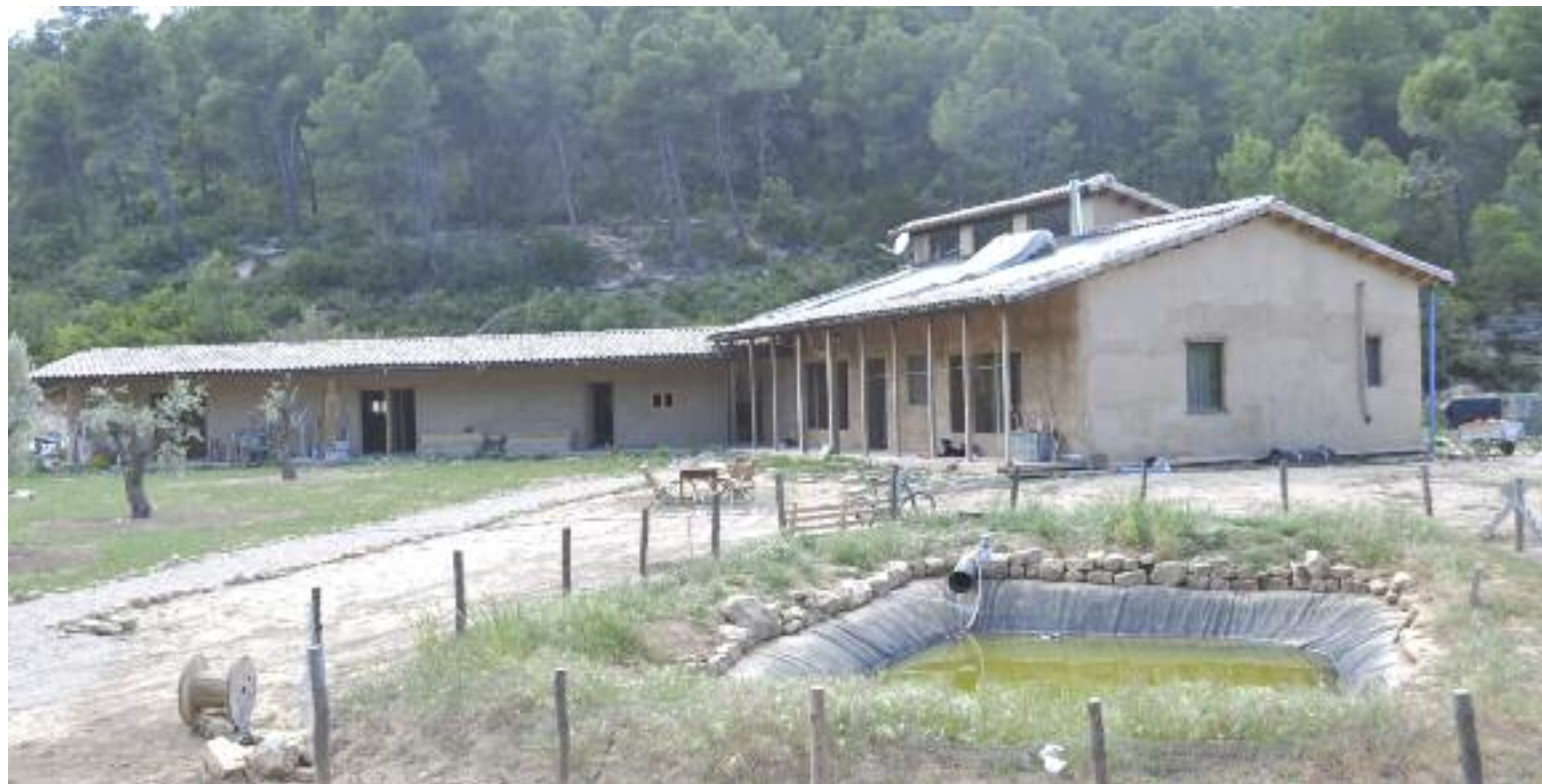
Mas La Llum, un proyecto sostenible y respetuoso con el entorno en Arens de Lledó

yecto de turismo rural, es una manera de entender y vivir la vida, y como apuntaba la propietaria de la casa "es así como nos sentimos bien", porque "intentamos explicarle a la gente que con unos pequeños cambios en nuestra vida todo es más sostenible". Ambos colaboran realizando cursos y talleres sobre bioconstrucción.