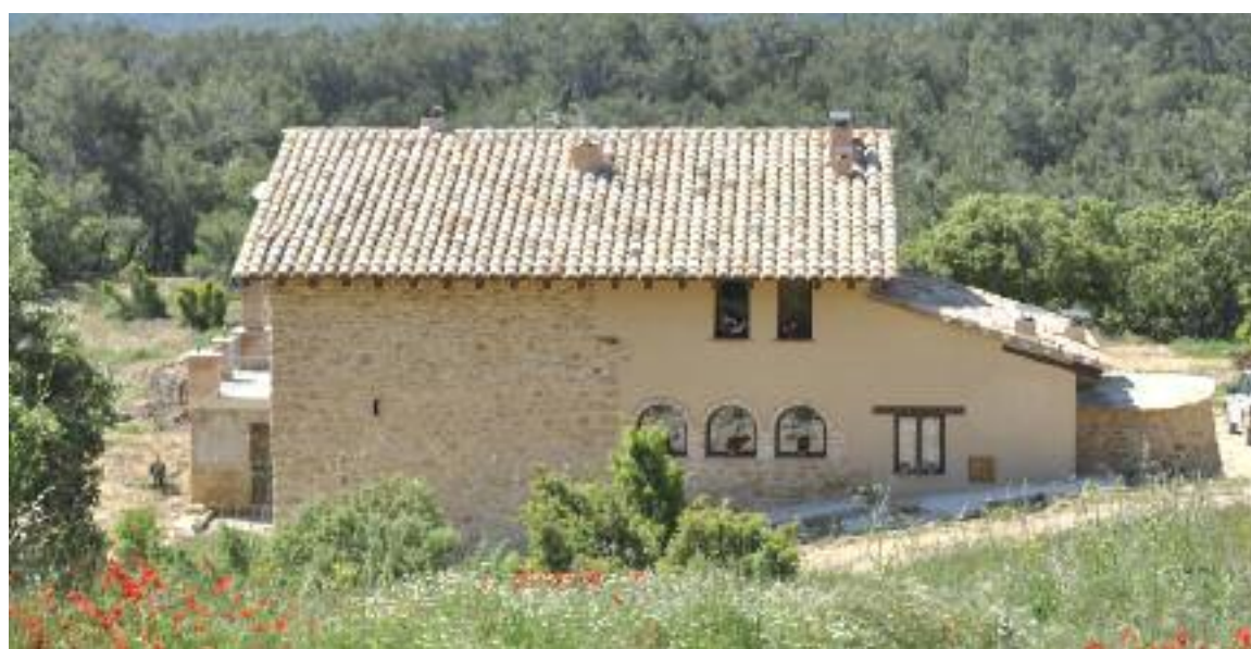
La antigua masía rehabilitada como vivienda de turismo rural

Según explicó la copropietaria, "la masía estaba a punto de caerse, así que decidimos arreglarla y darle un uso como vivienda de turismo rural". Las obras supusieron una remodela-