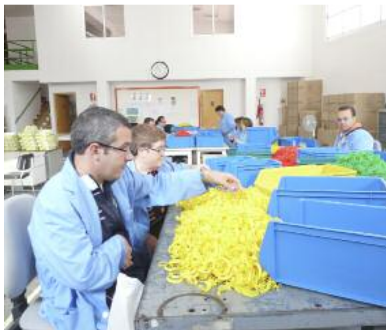
Centro ocupacional de Kalathos en Alcorisa

Calaceite y a los usuarios del centro de día de Asapme.