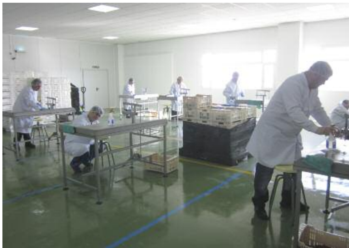
Instalaciones del Centro especial de empleo de Asapme en Calanda

En Calanda también se encuentra el centro especial de empleo de Asapme, que se fundó en 2011 y que comenzó realizando trabajos de ajardinamiento. Sin embargo, "al ver que no había mucho trabajo, decidimos cambiar, y en este momento 30 personas realizan, en dos turnos, tareas de deshuesado de ciruelas para una empresa local". Además, una persona está empleada en tareas de limpieza, otra en trabajos como administrativa y dos personas desarrollan su trabajo en el servicio de comidas a domicilio, que se sirven tanto a ancianos en Calanda como a la residencia de