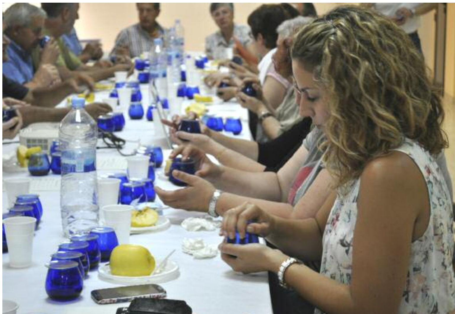
Un grupo de personas participa en una cata de aceite de oliva

Por otra parte, a través también del programa europeo Eurenens, la organización Omezyna también ha participado en un proyecto piloto de cálculo de la huella del carbono en un litro de aceite de oliv. En este caso, lo que se ha valorado es cuántos gases de efecto invernadero se generan al producir un litro de aceite de oliva en el territorio. Para ello, la técnica del Punto de Infoenergía realizó estudios de campo (en el proceso de producción), en la almazara (en el proceso de elaboración y transformación) y también en la momento de la recepción por parte del consumidor, lo que afecta tanto