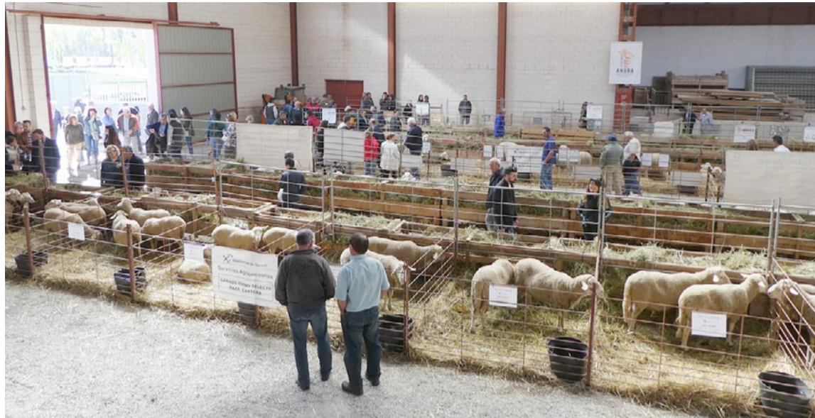
Exposición de ovino en la pasada edición de la Feria de Cedrillas

La Feria de Cedrillas celebrará dos subastas de ganado. El sábado será el turno de la de ovino, en