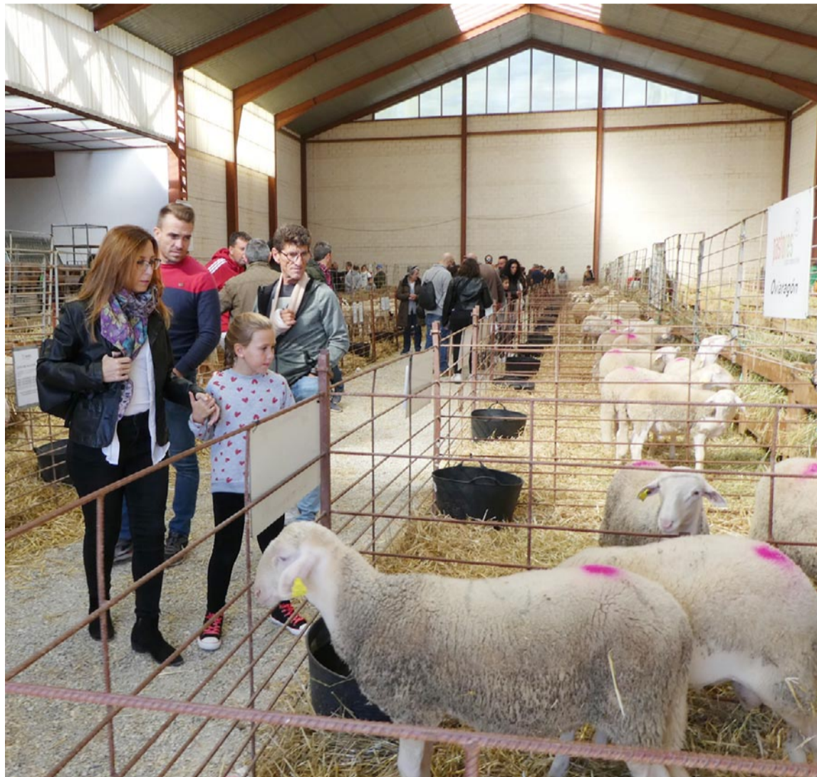
La Feria de Cedrillas celebró el año pasado su 130 edición

A todo ello se sumarán las clásicas subastas de ganado que se desarrollarán durante todo el fin de semana, las demostraciones de manejo de perros de pastoreo o la presentación de sementales equinos de pura raza. Tampoco faltará a su cita en Cedrillas Mi-