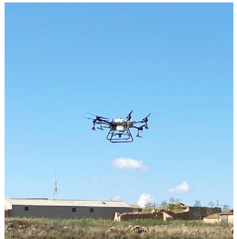
Los drones se pueden programar para que realicen el trabajo de forma autónoma

alizarán dos demostraciones prácticas del manejo de estos aparatos. Las exhibiciones de pulverización tendrán lugar el sábado a las 16:00 horas y el domingo a las 12:00 y se realizarán en la misma parcela en la que se realizarán las demostraciones de manejo de ganado con perros. "Es una zona que está delimitada y vallada por seguridad y vamos a aprovechar para que se vea cómo se progra-