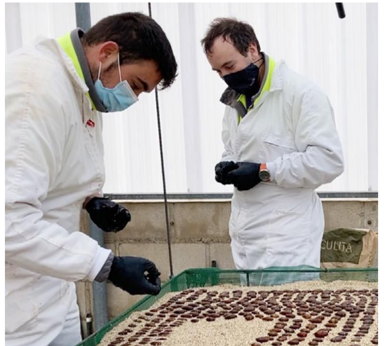
Trabajo en el Vivero de truficultura de la Fundación Térvalis

Se trata de un catálogo de soluciones nutricionales, porque insisten en Térvalis- no son fertilizantes al uso, ya que varían en función de valores como la edad de la plantación o algunos problemas que puedan presentar, proponiendo diferentes soluciones que se pueden aplicar en el cultivo para mejorar su producción. Con ellos se busca mejorar la implantación de los plantones